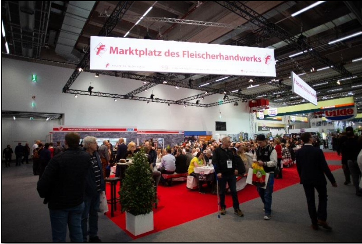
Marktplatz des Fleischerhandwerks